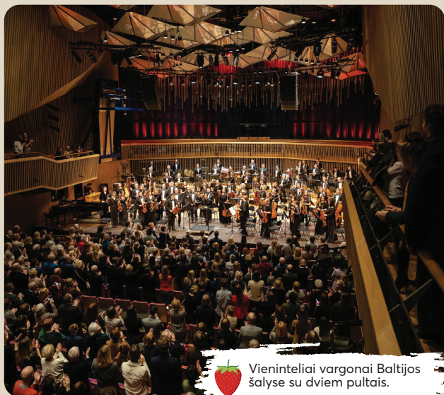
Vieninteliai vargonai Baltijos šalyse su dviem pultais.