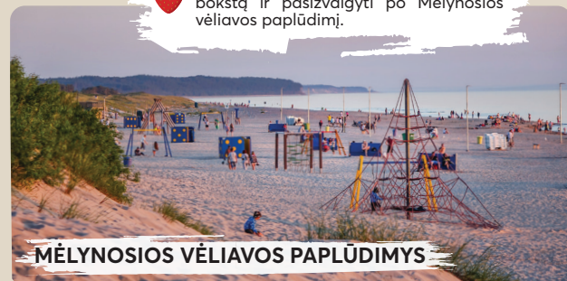
MĒLYNOSIOS VĒLIAVOS PAPLŪDIMYS

Nuo gegužĒs 15 d. iki rugsĒjo 15 d. galima ūzkopti ģ atnaujintā paplŪdimio bokštā ir pasizvalgyti po MĒlynosios vĒliavos paplŪdimį.