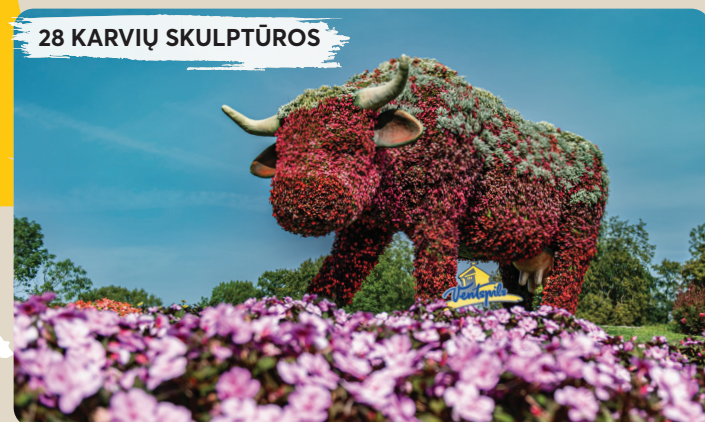
28 KARVIŪ SKULPTŪROS