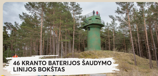
46 KRANTO BATERIJOS ŠAUDYMO LINIJOS BOKŠTAS