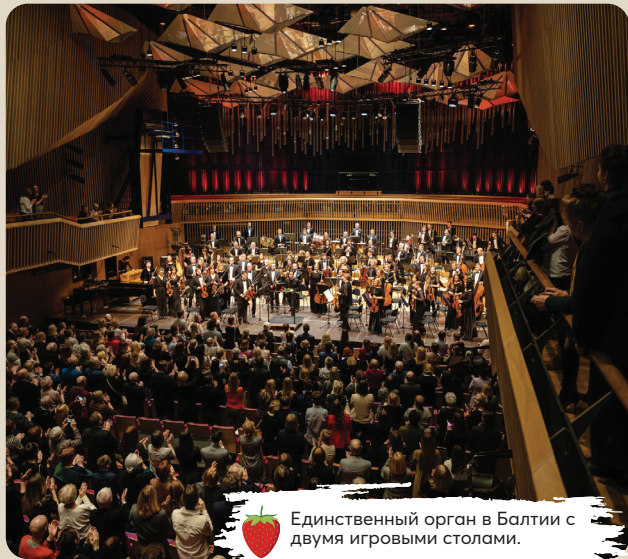
Единственный орган в Балтии с двумя игровыми столами.