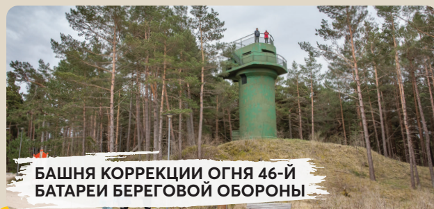
БАШНЯ КОРРЕКЦИИ ОГНЯ 46-Й БАТАРЕИ БЕРЕГОВОЙ ОБОРОНЫ