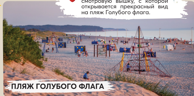
ПЛЯЖ ГОЛУБОГО ФЛАГА

С 15 мая по 15 сентября можно взобраться на обновленную смотровую вышку, с которой открывается прекрасный вид на пляж Голубого флага.