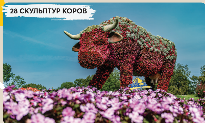
28 СКУЛЬПТУР КОРОВ