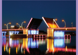
38 PAKELIAMASIS VENTOS TILTS