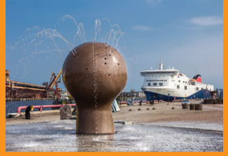
2 FONTANAS „LAIVŪ STEBĒTOJAS“