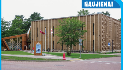
16 PIEJŪRIO GĀMTOŠ MUZIEJUS Rinka iela 2, Ventspils