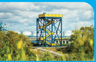
24 PIETINIO MOLO APŽVALGOS BOKŠTAS