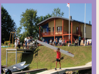
34 IRKLAVIMO BAZĒ „DAMPELĪ”