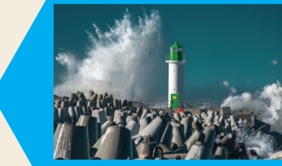
28 PIETINIO MOLO ŠVĒTURYS