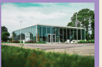
33 GALINCIEMO BENDRUOMENĒS CENTRAS