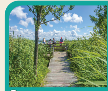
48 BŪŠNIEKU EŽERS Platforma, skirta paukščīams stebētī