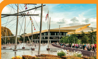
8 KONCERTŪ SALĒ „LATVIJA“ IR FONTANAS „FREGATA „BANGINIS“ Lielais laukums