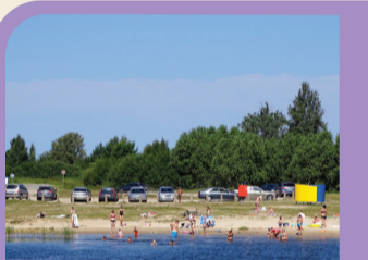
36 POILSIO VIETA PRIE VENTOS