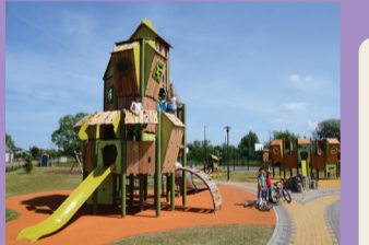
35 ŽAIDĪMŪ AIKŠTELĒ „BRĪNUMZEME”