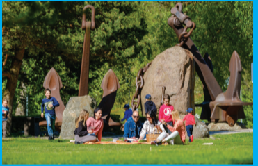
18 JŪRMALOS PARKS