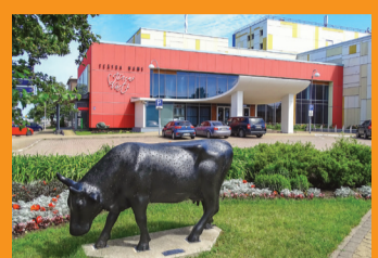
6 TEATRO NĀMAI „JŪRAS VĀRTI“