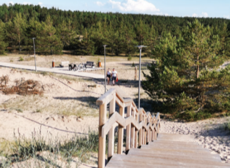
15 PRIĒJIMAS PRIE JŪROS 10. Lieptas (šioje vietoje galima 1vedziotis šunis)