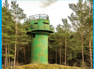
14 KARINIS PAVELDAS 46. Kranto apsargos artilerijas baterijas bokštas