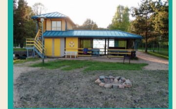
47 BŪŠNIEKU EŽERO VALČĪJU BAZĒ