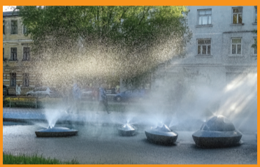
9 FONTANAS „SAULĒS LAIVĒLIAI“ IR GĒLIŪ SKULPTŪRA „BOBSLĒJINĪKAJ“ Jaunpilsētas laukums