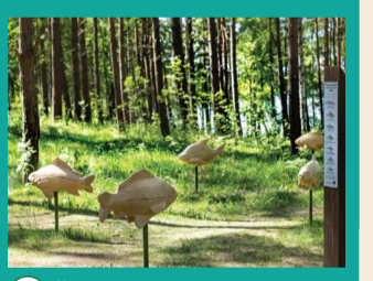
51 ŽUVŪ SKULPTŪROS