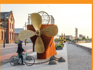
5 UOSTA GATVĒS PROMENADA