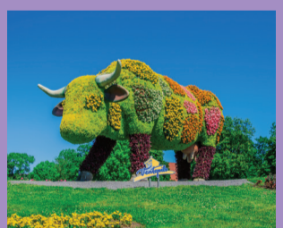
39 GĒLIJU KARVĒ