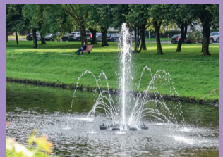
40 VIDUMŪPYTĒS FONTANAS PRIE PREKĪBAS CENTRO „TOBAGO”