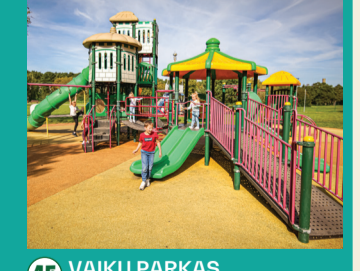
45 VAIKU PARKAS „FANTAZĪJA” Rangiņīai sekmādienīais 15.00 val.