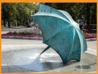
10 FONTANAS „LIETSARGIS“ Laikrakstu aleja