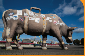
4 KARVĒ KELIAUTOJA