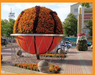
11 GĒLIŪ SKULPTŪRA „KREPSĪNIO KAMUOLYS“ Olimpiskais centrs „Ventspils“