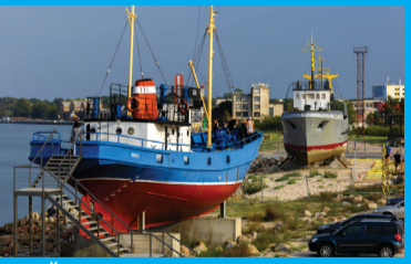
25 ŽVEJU LAIVAI „GROTS“ IR „AŽOVA“