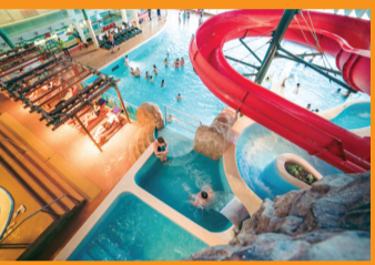
12 VANDENS NUOTYKIŪ PARKS