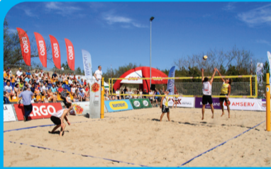
20 PAPLŪDĪMIO TINKLINIO STADIONAS