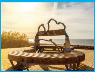
21 APLINKOS OBJEKTS „LATVIJOS KONTŪRINIS ŽEMĒLĀPIS“