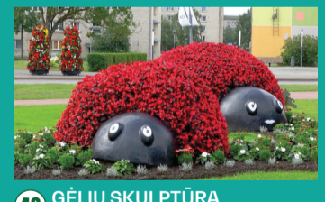
43 GĒLIJU SKULPTŪRA „BORUŽĪJU ŠEIMA ANT RAMUNĒS”