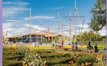
30 KONCERTU SALĒ „LATVIJA” IR FONTANAS „FREGATA BANGINIS”