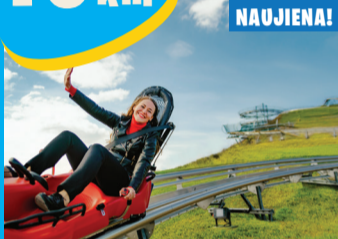
13 NUOTYKIŪ PARKS IR NUSILEIDĪMO TRASA