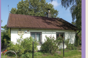
32 H. DUORBĒS MUZEJUS „SENČŪ PUTEKLĪ”