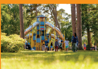
7 VAIKŪ MIESTELIS Renginiai sekmadienais 11.00 val.