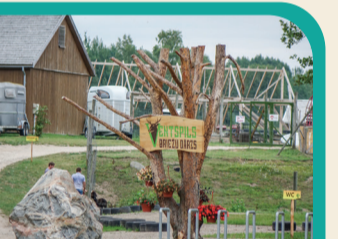
49 VENTSPĪLIO ELNĪŪ PARKAS