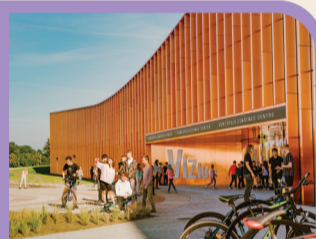
37 MOKSLO CENTRAS „VIZIUM”