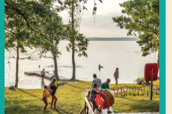
50 BŪŠNIEKU EŽERAS IR MAUDYMOSI VIETA