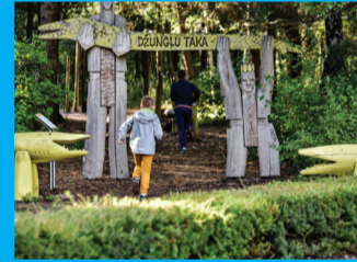
19 DŽUNGLIŪ TAKAS