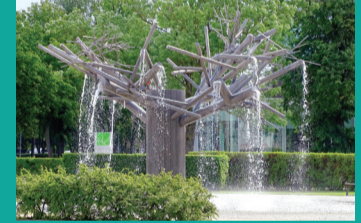
42 FONTANAS „KOPŪ PUŠIS”