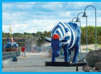
27 KARVĒ JURINĪKĒ