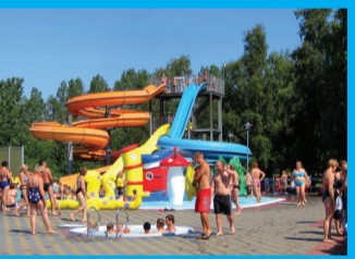
22 PAPLŪDĪMIO VANDENS PARKS