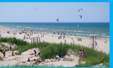
23 MĒLYNOSIJS VĒLIAVOS PAPLŪDĪMĪS