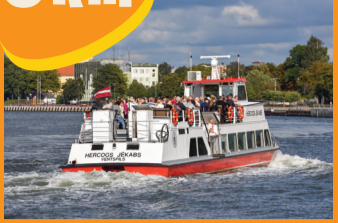
1 EKSKURSIJŪ LAIVAS „HERCOGS JĒKABS“