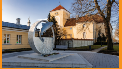
3 LIVONIJOS ORDINO PILIS IR APLINKOS OBJEKTS „LATAS“