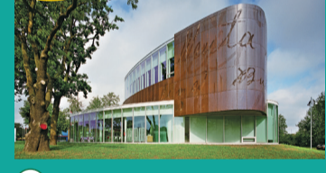
41 PARVENTOS BIBLIOTĒKA