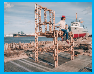
26 KĒDĒ IŠ GRANDINIŪ