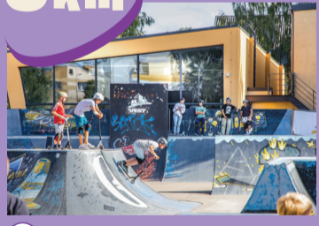
29 RIEDLENČŪ PARKAS