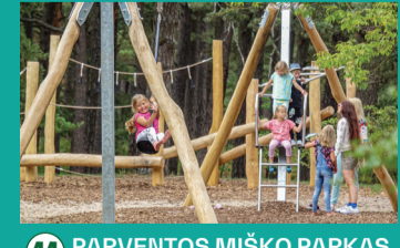
44 PARVENTOS MIŠKO PARKAS SU MIŠKO TAKU IR LAUKO TRENIŅUOKĻAIS